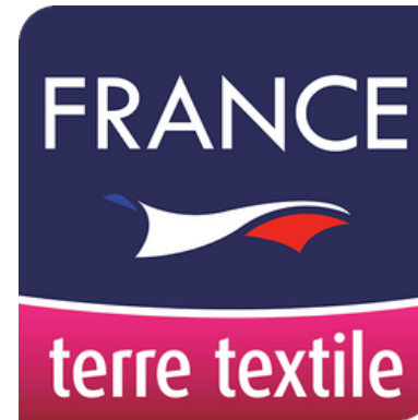
France terre textile