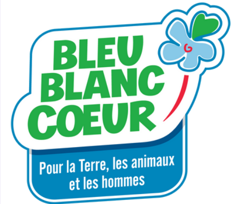
Bleu Blanc Cœur