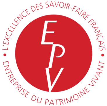
Entreprise du patrimoine vivant