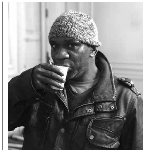
Le SIAO (Service Intégré d'Accueil et d'Orientation)

Le permanencier 115 écoute, et évalue la situation, il informe des possibilités existantes et oriente sur les dispositifs et services d'urgence sociale du Loiret, avec lesquels il se met en lien. Il s'agit de mettre à l'abri les personnes les plus vulnérables, en leur donnant une réponse immédiate sur les possibilités d'hébergement et d'accueil.